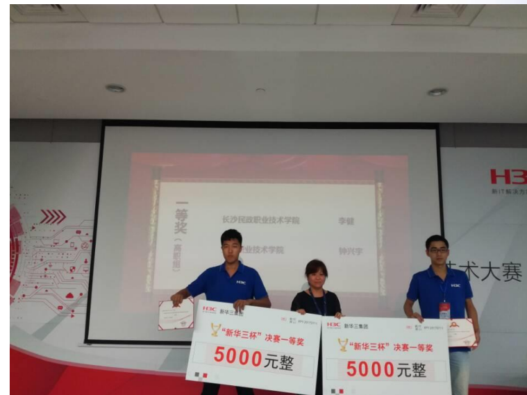
2017新华三杯大学生网络大赛一等奖