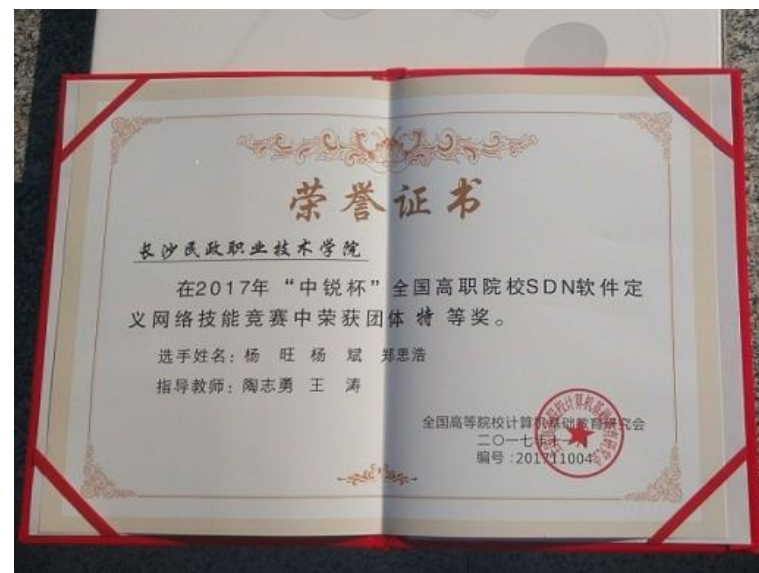
2017全国高职学生SDN大赛特等奖